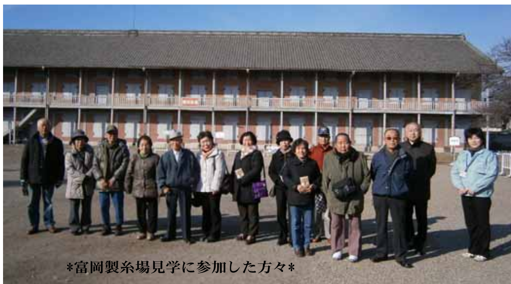
*富岡製糸場見学に参加した方々*

1月19日(木)に13名の参加で富岡製糸場の見学に行ってきました。寒さの中でも天候に恵まれ貴重なお話を聞き、とても有意義な時間を過ごすことができました。