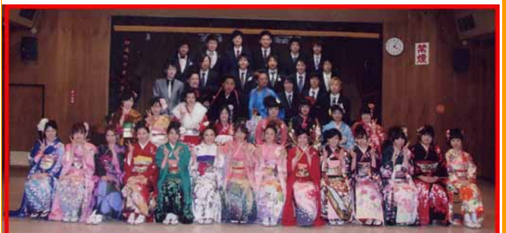
*成人式に出席した方々*

先月8日「成人式」が、かぶら文化ホールで行われました。妙義地区では48名(男性20名・女性28名)の方たちが、成人としての1歩を踏み出しました。皆さん、おめでとう!