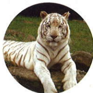
今年の干支 寅(とら)