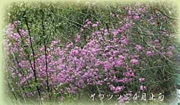
イワツツギ 4月上旬

神成山は里山ですが全コース尾根歩きの素晴らしいコースです。 春夏秋冬いつでも自然満喫の散策が楽しめます。