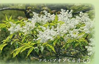
マルバアオダモ 4月下旬