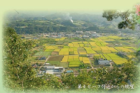
第4ピーク付近からの眺望