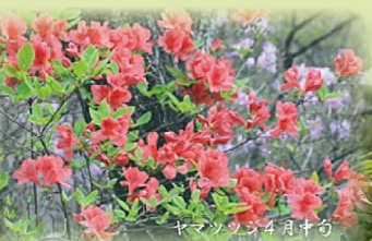
ヤマツツギ 4月中旬