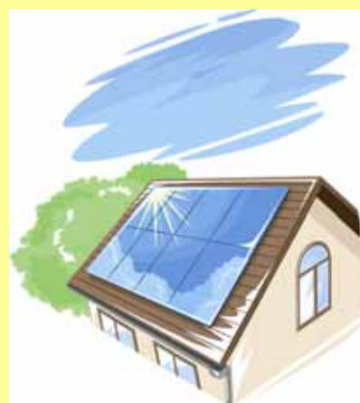
太陽光発電システム整備導入計画