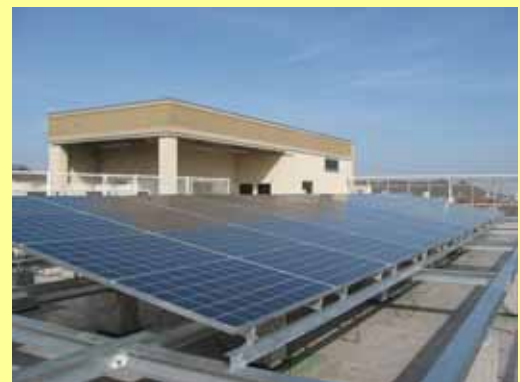
あい愛プラザに設置した太陽光発電システム