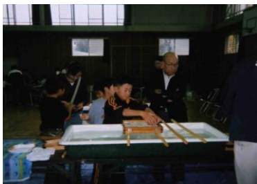
ケナフで紙すきをしました

11月14日(日)には、ケナフの茎を使って紙すきを体験しました。子どもも大人も力を合わせ、押し花やハガキ作り、6年生は繭を使った花造りに精を出していました。最後、全員でいただいたとん汁は格別に美味しかったです。(記: 黛)