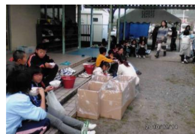
とん汁が美味しかった～!