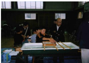
ケナフで紙すきをしました

11月14日(日)には、ケナフの茎を使って紙すきを体験しました。子どもも大人も力を合わせ、押し花やハガキ作り、6年生は繭を使った花造りに精を出していました。最後、全員でいただいたとん汁は格別に美味しかったです。(記: 黛)