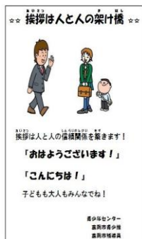
あいさつポスター