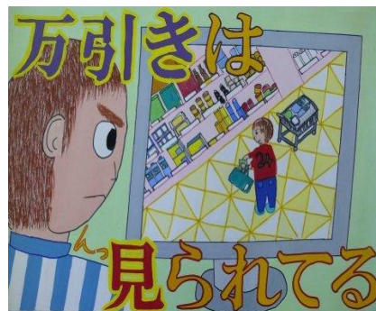
万引き防止ポスター