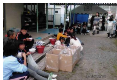
とん汁が美味しかった～!