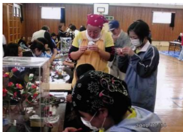
繭で花を造りました