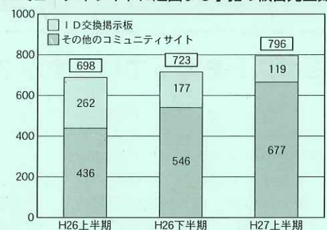
コミュニティサイトに起因する事犯の被害児童数

平成27年上半期の出会い系サイト及びコミュニティサイトに起因する事犯の現状と対策について：警察庁