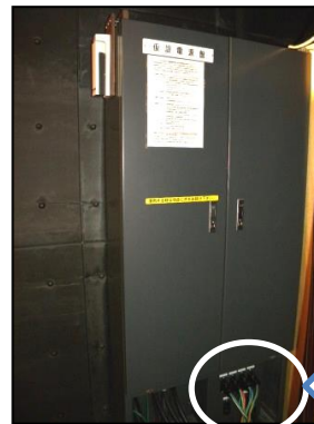
・上手仮設電源盤