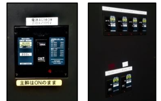
電源盤内部/ブレーカー