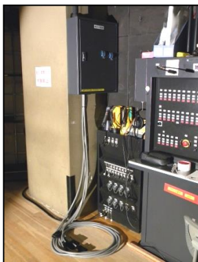
・下手仮設分電盤

C型30A4chマルチケーブル(15m) ・C型60A→C型30A変換ケーブル(8m+α)はホールにあります。