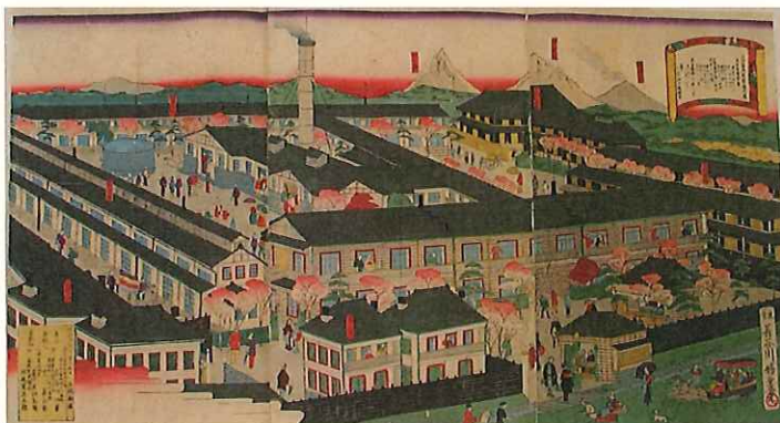
2 上州富岡製糸場之図 長谷川竹葉画 明治9年

3枚組の錦絵ですが、3枚が糊付けされている状態です。 つなぎ目は絵がずれています。(右側部分図参照)