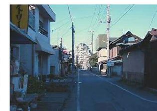
⑦車両のすれ違いのできない道路