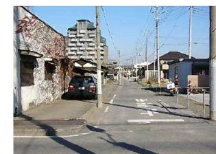
⑥狭い道路と市街地市営住宅