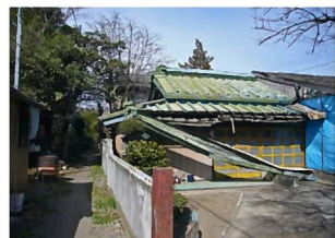
①老朽化した空き家