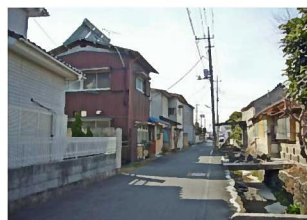
②狭い道路に面する住宅