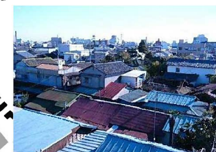
⑤密集する老朽住宅