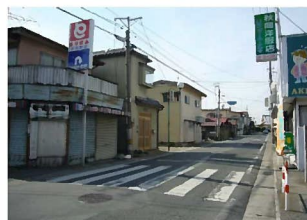
③歩道のない道路に面する住宅