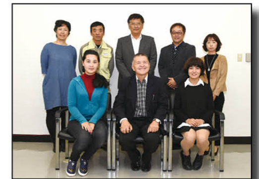
昨年のホストファミリーとウズベキスタンの学生ら

受け入れ期間 10月6日(金)～13日(金) 対象者 市内の家庭(単身世帯を除く) 募集家庭数 3家庭(応募多数の場合は抽選) ホームステイをする人 ウズベキスタンの男子学生(22歳)2人、女子学生(18歳)1人 受け入れ家庭へのお願い ▷受け入れは無償でお願いします。 ▷家族の一員としてお迎えください。 ▷集合・解散場所への送迎(主に市役所)、食事(昼食を除く)、可能であれば個室の提供などをお願いします。 ※その他日程など、詳しくは市ホームページでご確認いただくか、お問い合わせください。