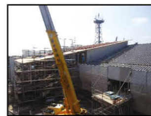
議会議事棟工事の様子(7月14日現在)