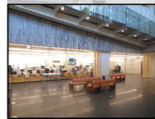
行政棟で窓口業務開始(7月3日)

市役所全面オープンは、旧庁舎跡地に前庭を整備後の平成30年3月を予定しています。その間、正面玄関が使用できないなど、ご迷惑をお掛けしますが、ご理解とご協力をお願いします。