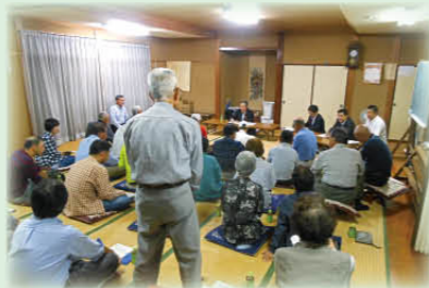
市政懇談会の様子 (10月12日、宮崎西公会堂)

今後も皆さまの声につぶさ に耳を傾け、ご満足いただけ る、真心のこもったサービ ス提供に努めてまいります。