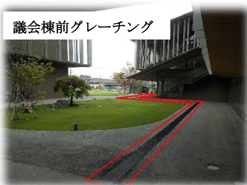
議会棟前グレーチング