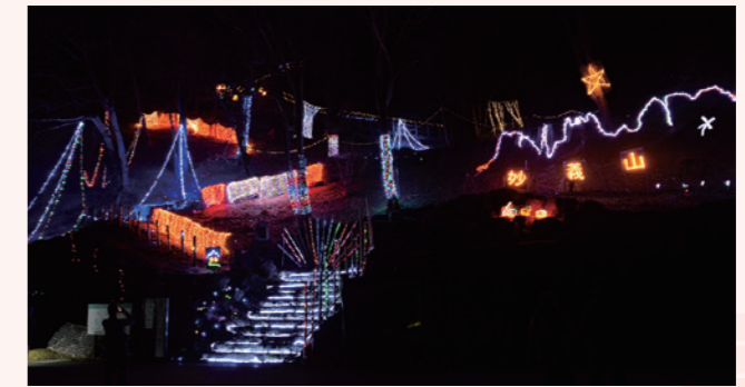
妙義山の斜面に設置されたイルミネーション

道の駅まよろぎ周辺に、妙義山や干支のネズミをモチーフにしたイルミネーションが設置され、色とりどりの光で新年が祝われました。この事業は妙義山を愛する会と市観光協会妙義山特別委員会が共同し、今年は規模を拡大して実施。イルミネーションの他、妙義神社に手作りの竹灯籠を灯した幻想的な演出も行われました。