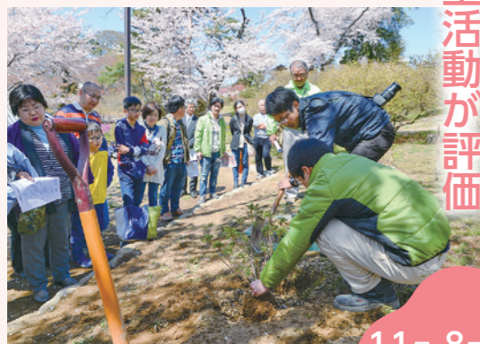
ツツジの試験移植の様子（昨年4月、旧茂木家住宅つづじ祭りにて）

平成28年度から宮崎公園のツツジ保全活動に取り組んできた富岡実業高校草花部が、その研究成果を認められ、第12回群馬銀行環境財団教育賞で優秀賞を受賞しました。部員は、「今後も育成苗の配布や移植など、市や地域と連携し、持続可能な活動を行いたい」と語りました。