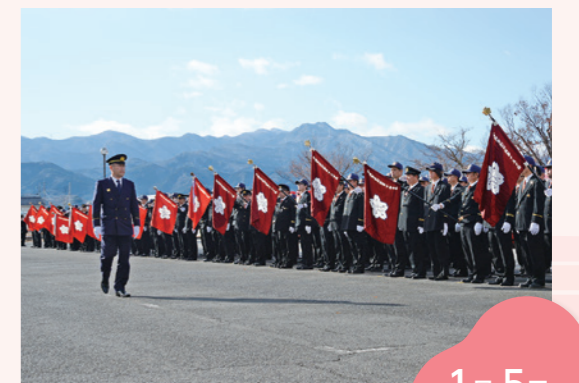
観閲する市長と消防隊員

生涯学習センターで消防隊出初式が行われました。新春の澄んだ空気の中、駐車場に整列した約200人の消防隊員と消防車の前を、市長が観閲しました。ホールでの式典では、永年にわたって地域の防災に尽力した団員や消火活動に協力した人たちが表彰されました。