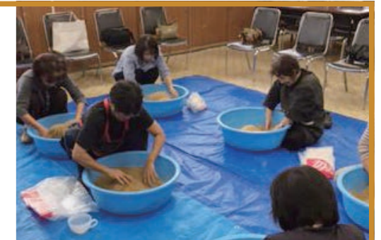
ぼかし作り講習会の様子

総合計画中期基本計画との対応 ごみの減量化・循環利用の推進、農産物販路の多様化促進など