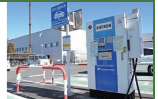
電気自動車用充電設備（上町駐車場）